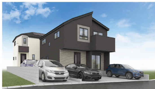
外観完成予想CG ※外構・植栽はイメージであり施工上の都合により変更となる場合がございます。