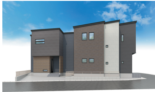
外観完成予想CG ※外構・植栽はイメージであり施工上の都合により変更となる場合がございます。