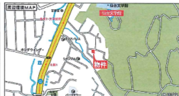
カーナビ表示宮城県仙台市青葉区北根2丁目4-11