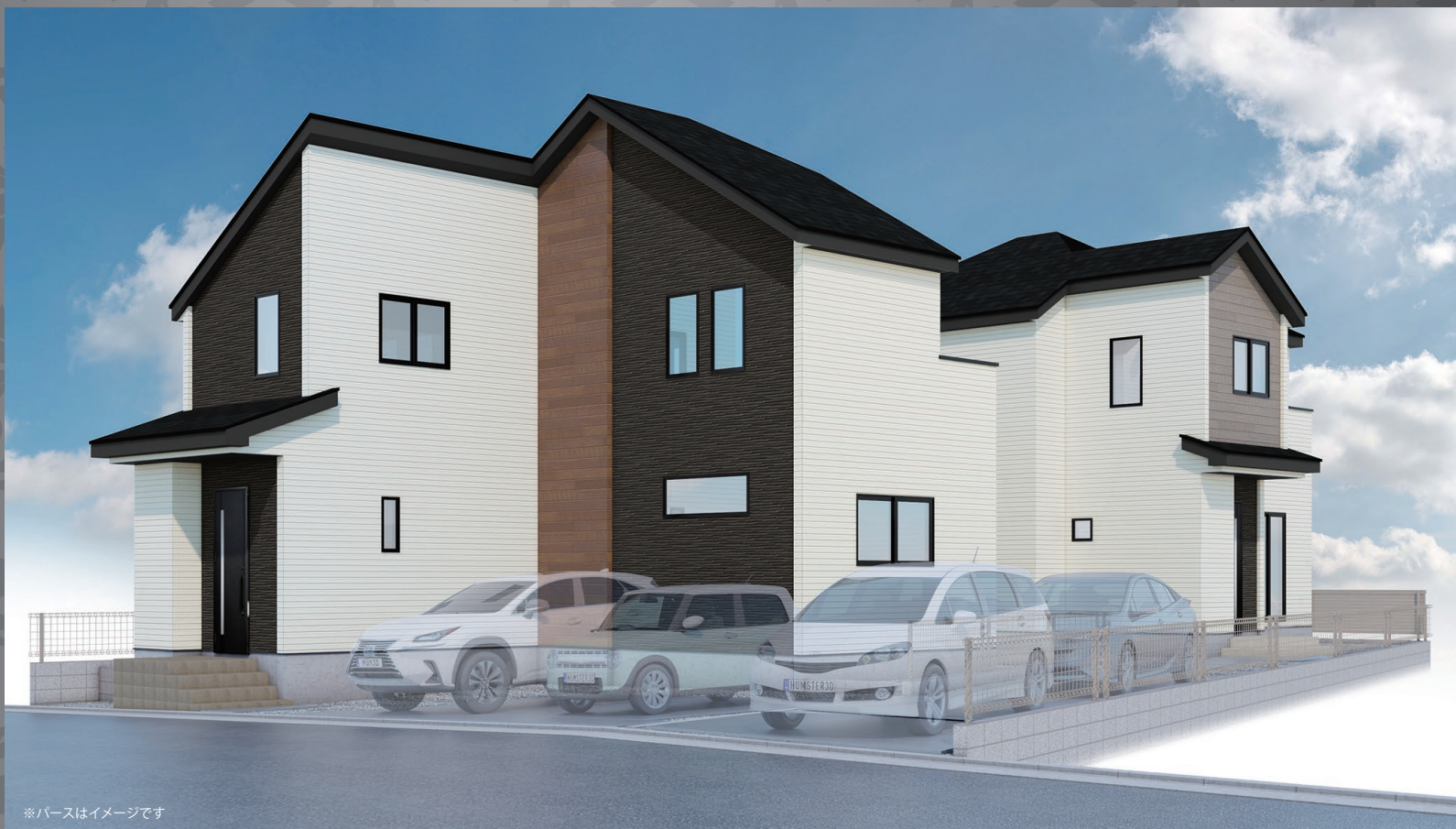
※パースはイメージです