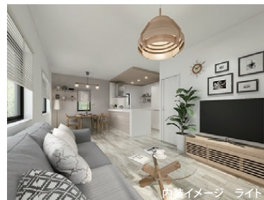
内装イメージ ライト