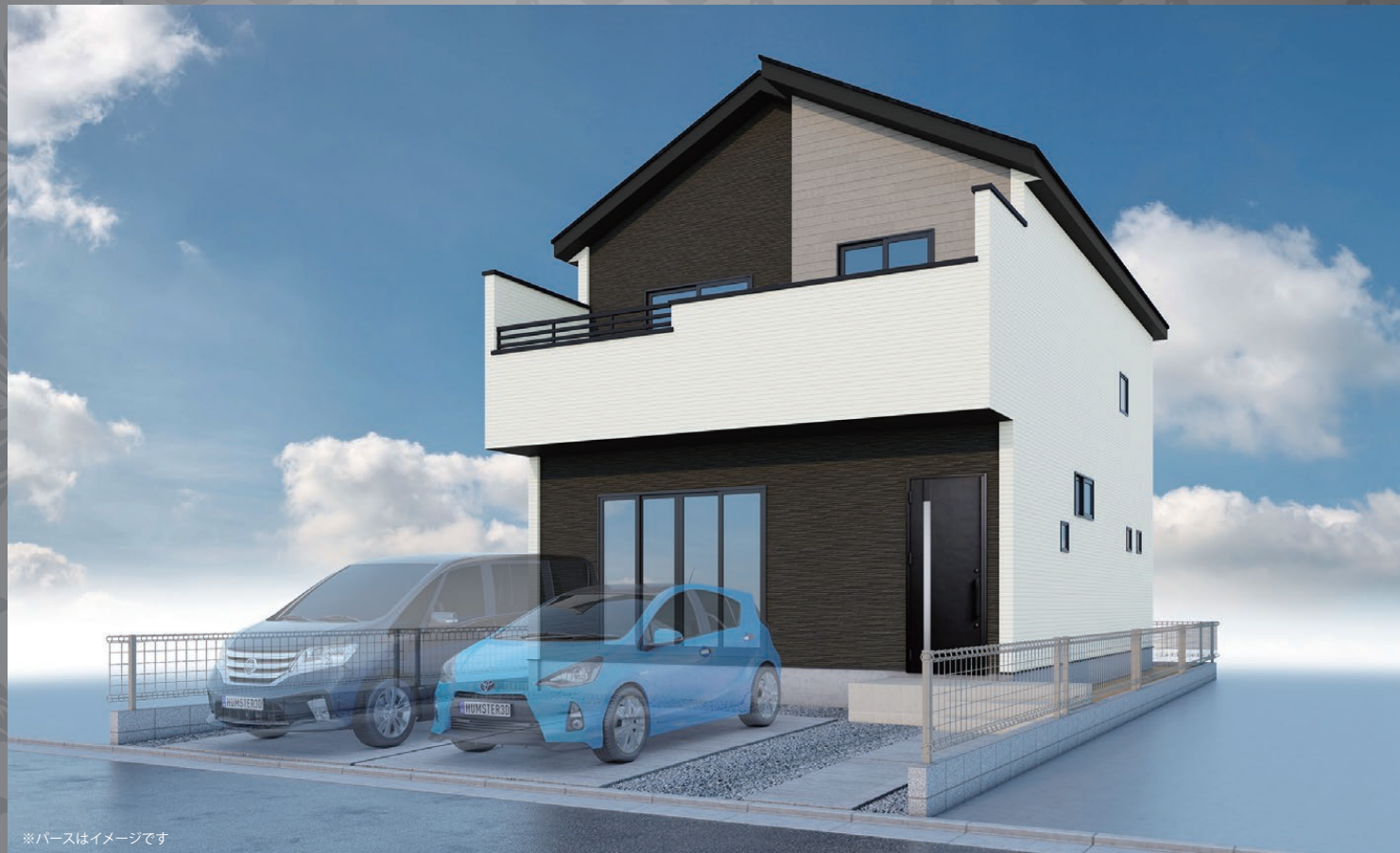
※バスはイメージです