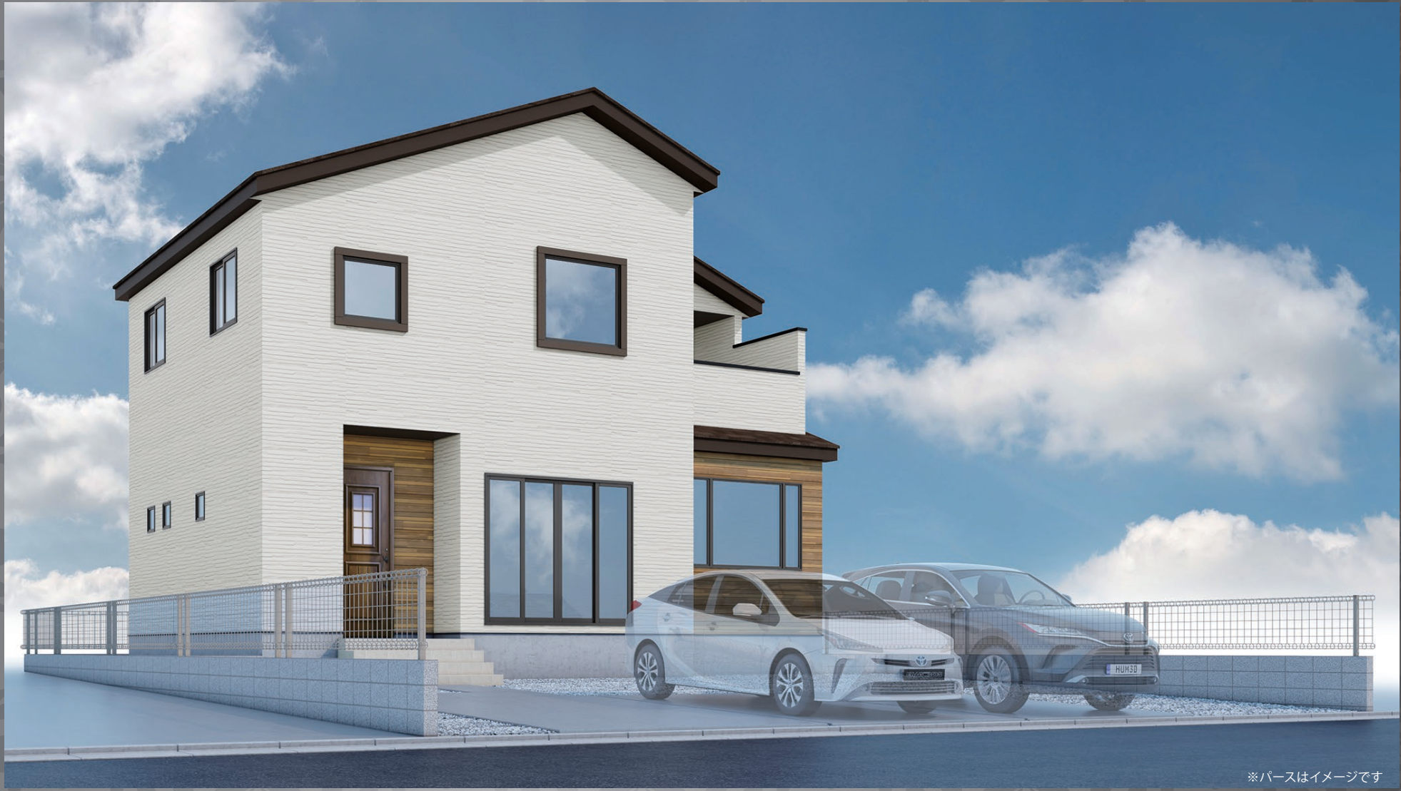
※パースはイメージです

地下鉄南北線 「泉中央」駅 徒歩 78分 「泉中央」駅 車 13分 バス 19分 バス停「富ヶ丘3丁目」まで徒歩 3分