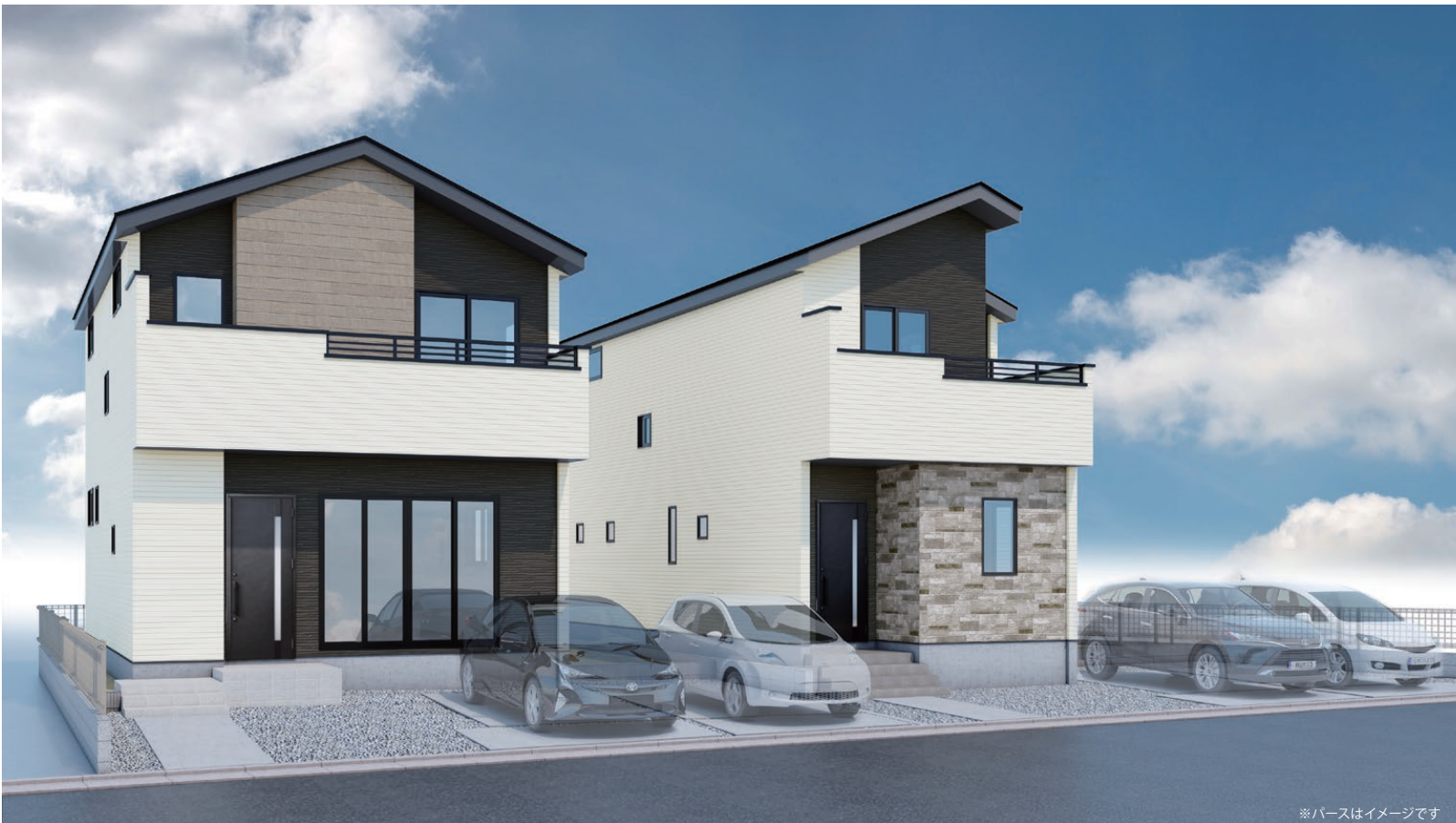
※バスはイメージです