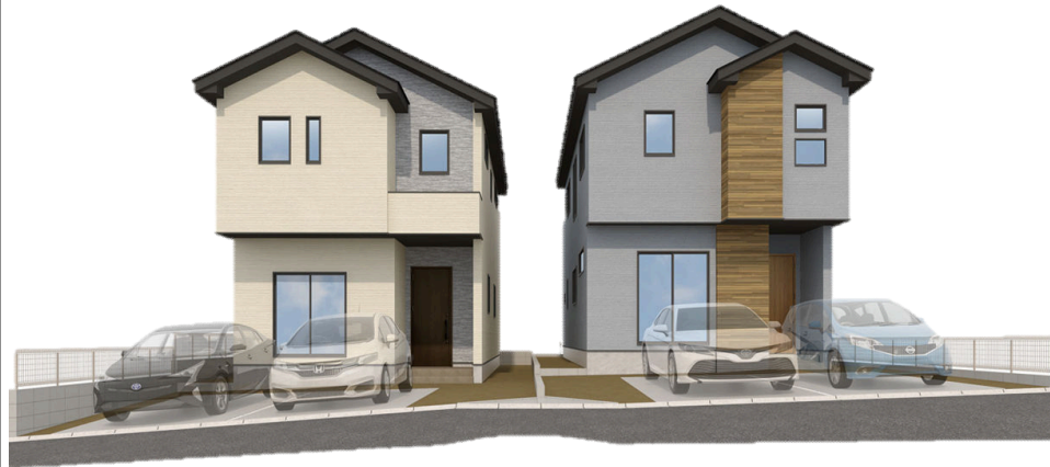
仙台市青葉区桜ヶ丘5期2棟 外観イメージ