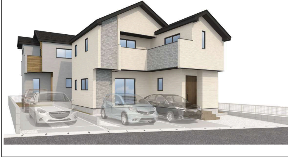
KIS仙台市泉区黒松3期完成予想図※バスはイメージです。