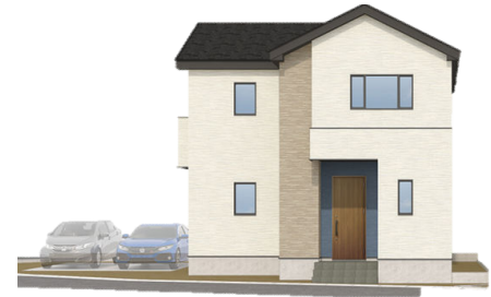
※外観パースはイメージです。

太陽光から様々な色を映し出すprismのように、 priSUMA～プリズマ～はあなたの新しい日常を彩ります。