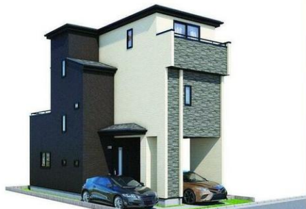
※イメージ図になります(実際の仕様、外観等異なる場合があります)。