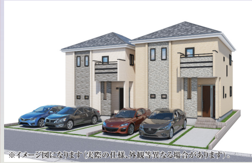
※イメージ図になります(実際の仕様、外観等異なる場合があります)。