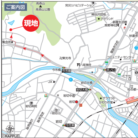
カーナビ入力 宮城県仙台市宮城野区岩切字台屋敷9-9