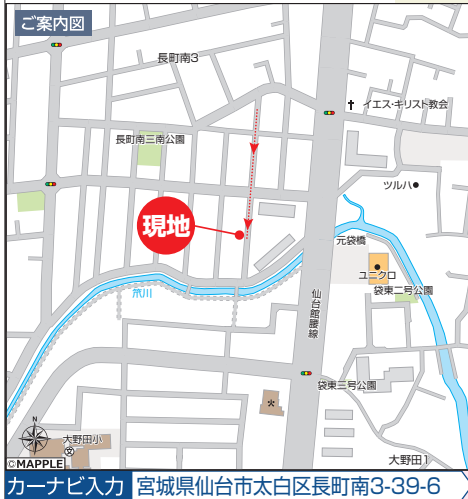
カーナビ入力 宮城県仙台市太白区長町南3-39-6