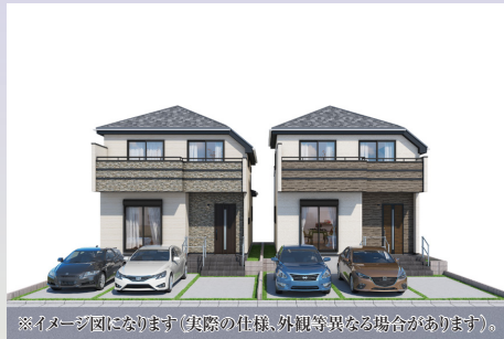
※イメージ図になります(実際の仕様、外観等異なる場合があります)。