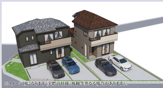
※イメージ図になります(実際の仕様、外観等異なる場合があります)。