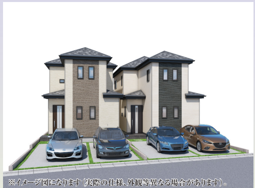
※イメージ図になります(実際の仕様、外観等異なる場合があります)。