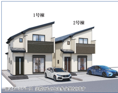
※イメージベース 実際のものは多少異なります