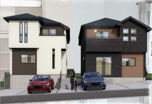
※イメージパースにつき実際とは多少異なる場合がございます。