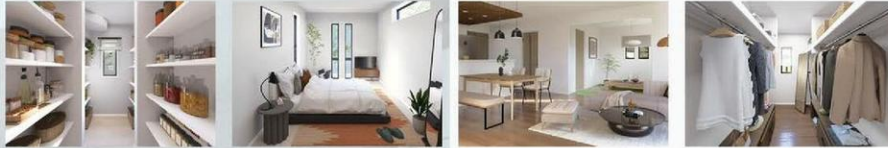
※室内イメージパースにつき実際とは多少異なる場合がございます。